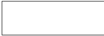
Figur 4.2 Göteborgs stadsvapen

Det är en symbol som är välkänd för alla kommunens invånare och som ofta används som symbol för kommunens verksamheter. På de kommunala bibliotekens webbplatser är det endast Västra Frölunda bibliotek och Göteborgs stadsbibliotek som inte har stadsvapnet för Göteborgs stad. Kortedala bibliotek samt Torslanda bibliotek länkar till Göteborgs stads webbplats genom att på sina webbplatser använda sig av kommunens stadsvapen.