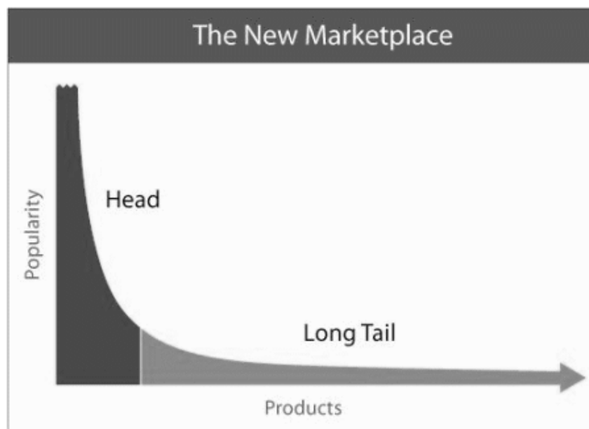
Figur 2. Från www.LongTail.com/about.html

Long tail betecknar ett uttryck som först myntades av Chris Anderson 2004, chefredaktör för den amerikanska tidskriften Wired (Anderson 2007, s. 21). Försöket att grafiskt beskriva en vanlig tendens när en ny produkt lanseras på marknaden ger ofta en graf som antar formen av en skidbacke. Initialt efterfrågas produkten på marknaden men ganska snabbt sjunker kurvan och stabiliserar sig på en låg men relativt jämn nivå. Den del av kurvan som sjunker antar formen av en lång svans och det är den långa svansen som har fått namnge det fenomen som inom ekonomin kallas long tail.